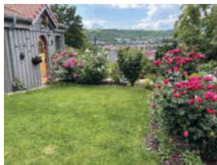
(Ziergarten Familie Grimm Veitshöchheim by Jessica Tokarek)

Details zum Programm und die teilnehmenden Anwesen finden Sie unter www.landkreis-wuerzburg.de .